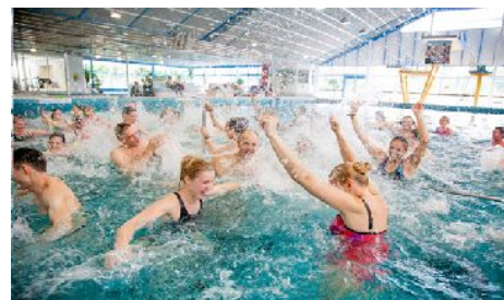
In Aqua Sana Est ~健康は水の中にある~