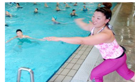
第193回アクアフォーラム21('15年4月/三鷹)