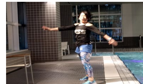
第205回アクアフォーラム21(17年2月 / 東京)

□レベル: インター (中級者向け) □フォーマッ ト: ミディウム (中強度) □システム: カーディオ (循環系) □カテゴリー: ダンス (コリオ系) □ギ ア: なし