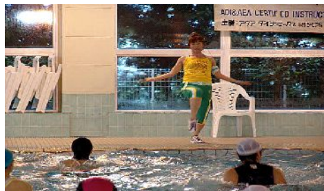
第170回アクアフォーラム21(11年5月 / 千葉)

□レベル: インター (中級者向け) □フォーマッ ト: ミディウム (中強度) □システム: カーディオ (循環系) □カテゴリー: ダンス (コリオ系) □ギ ア: なし