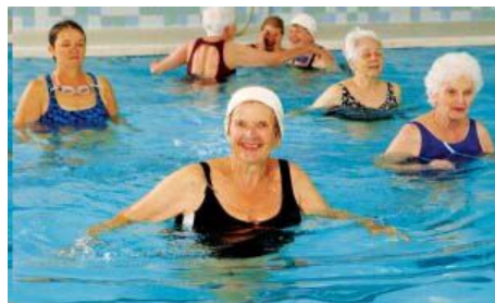
In Aqua Sana Est (健康は水の中にある)

□レベル: ビギナー (初級者向き) □フォーマッ ト: ロー (低強度) □システム: カーディオ (循 環系) □カテゴリー: ノンダンス (非ダンス系) □ ギア: あり (ポケットストレッチ・タオル)