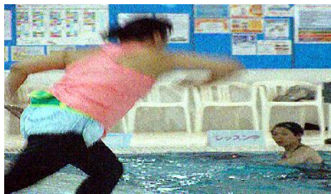
第196回アクアフォーラム21(15年11月 / 兵庫)

□レベル：ビギナー（初級者向け） □フォーマット：ロー（低強度） □システム：カーディオ（循環系） □カテゴリー：スペシャル（高齢者系） □ギア：なし