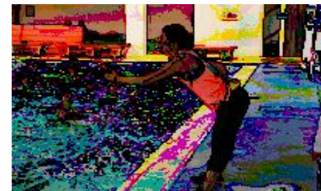
第13回フィットネス国内総会(18年8月 / 横浜)

□レベル：ビギナー・インター（初級者向け） □フォーマット：ロー・ミディアム（低中強度） □システム：カーディオ（循環系） □カテゴリー：インターバル（コンディショニング系） □ギア：なし