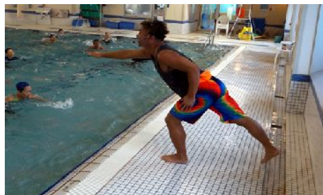
第202回アクアフォーラム21(16年10月/川越)