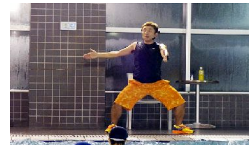
第198回アクアフォーラム21(16年2月/東京)