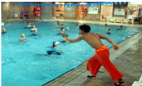
第193回アクアフォーラム21(15年4月/三鷹)