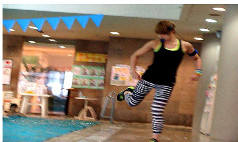
第193回アクアフォーラム21(15年4月/三鷹)

□レベル：ビジナー（初級者向け） □フォーマット：ミディアム（中強度） □システム：カーディオ（循環系） □カテゴリー：ダンスコリオ（ダンス系） □ギア：なし