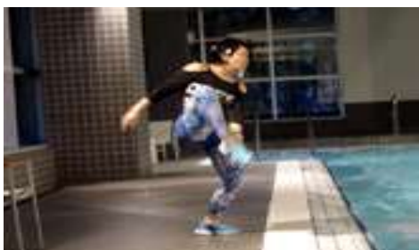
第205回アクアフォーラム21 (17年2月/東京)