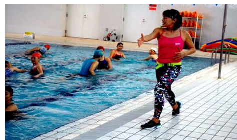
第210回アクアフォーラム21(17年11月/西宮)