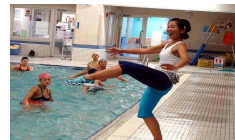
第195回アクアフォーラム21(15年10月/川越)