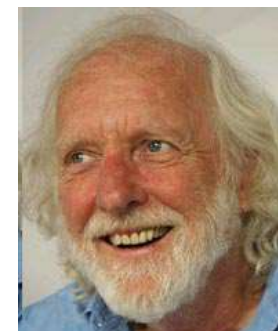
ハロルド・ダール Harld Dull ワッツ考案者。1980年、米国北カルフォルニアの温泉保養地ハービン・ホットスプリングに指圧マッサージ学校を開設。増永指圧の経絡ストレッチからヒントを得て、水中へ応用。水中マッサージを考案した。2019年7月死去。享年84歳