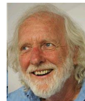
ハロルド・ダール Harold Dull ワッツ考案者。1980年、米国北カリフォルニアの温泉保養地ハービン・ホットスプリングに指圧マッサージ学校を開設。増永指圧の経絡ストレッチからヒントを得て、水中へ応用。水中マッサージを考案した。2019年7月死去。享年84歳